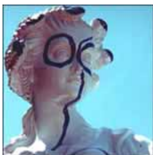
Karel Appel "Particolare delle Muse"