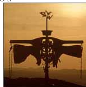
Daniel Spoerri "Senza Titolo"