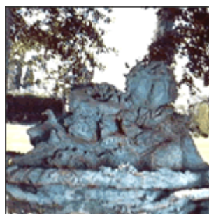
Roberto Barni "La pergola di Bacco"