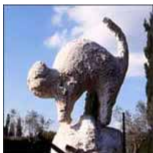
Karel Appel "Il Gatto"