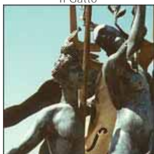
Arman "Apollo e Dafne"