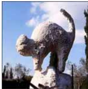
Karel Appel "Il Gatto"