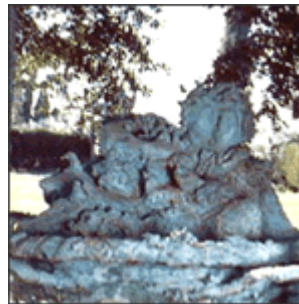
Roberto Barni "La pergola di Bacco"