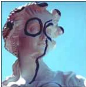
Karel Appel "Particolare delle Muse"