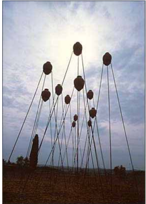
Franz Stahler "Orci"

Die permanente Kollektion an Freilichtskulpturen und die Gemäldeausstellungen können gegen Voranmeldung besichtigt werden.