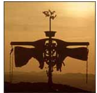
Daniel Spoerri "Senza Titolo"