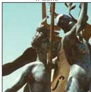
Arman "Apollo e Dafne"