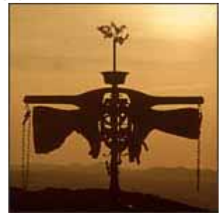
Daniel Spoerri "Senza Titolo"